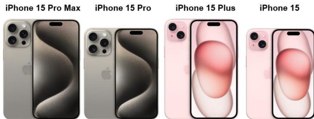
图表 1：iPhone15 系列