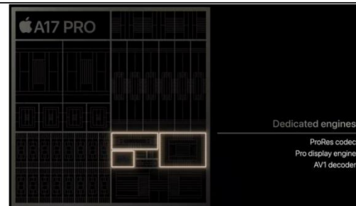
图表 6：A17Pro 芯片