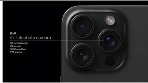
图表 7: iPhone15 Pro Max 长焦镜头